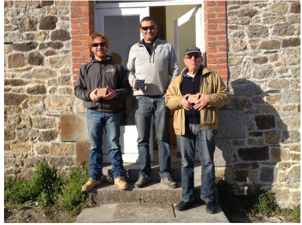
- le podium -