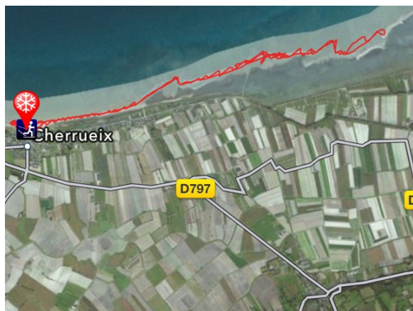
- parcours aller /retour complet -

- 13h00 : retour vers les Blokarts et on décide de retourner sur Cherrueix pour retrouver Arnaud et y disputer quelques manches amicales. Le retour s'avérera effectivement pas simple avec ce vent qui est quasiment de face ! A nouveau, chacun essaye de trouver la meilleure route (avec son lot d'embourbement) ; il faudra quasiment 1h pour parcourir en sens inverse les 7 km (voir extrait de trace) !!! Pour la petite histoire, trajet aller = 6,5km et trajet retour = 9,5km (louvoyage)