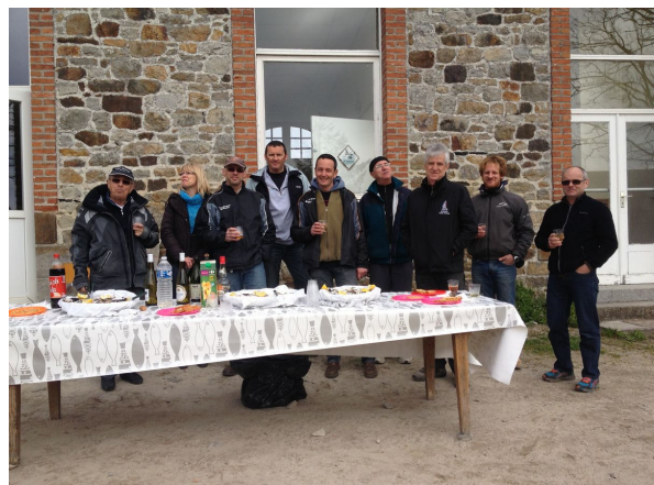
- les présents qui ont eu raison ! -