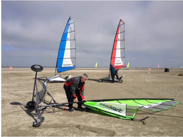
- Vital change de voile -