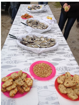
- bel apéro non ? -