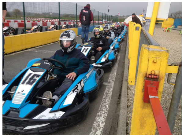
- "ça va sentir la gomme..." -