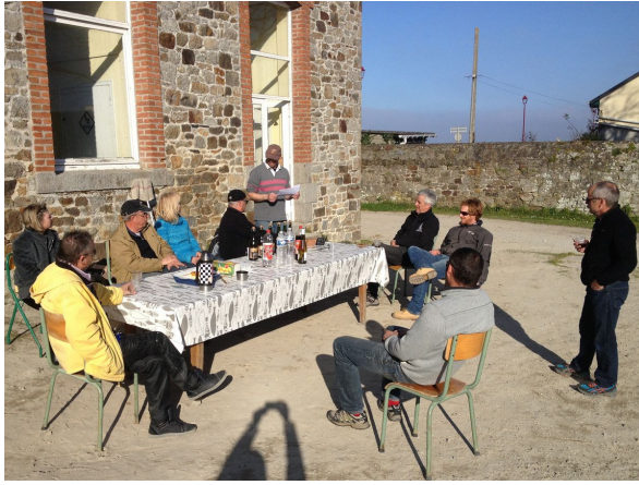
- la remise des prix -