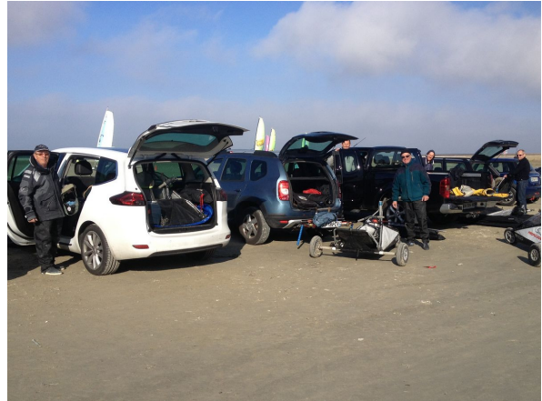
- rangement final -

- 15h45 : fin du roulage. Chacun range son matériel puis se dirige vers les locaux du club pour le classement final et la remise des prix. Cette année, le calcul du classement sera plutôt rapide (vu le nombre de pilote et surtout vu qu'un classement provisoire avait été calculé le midi). La remise des prix se fera au soleil encore !