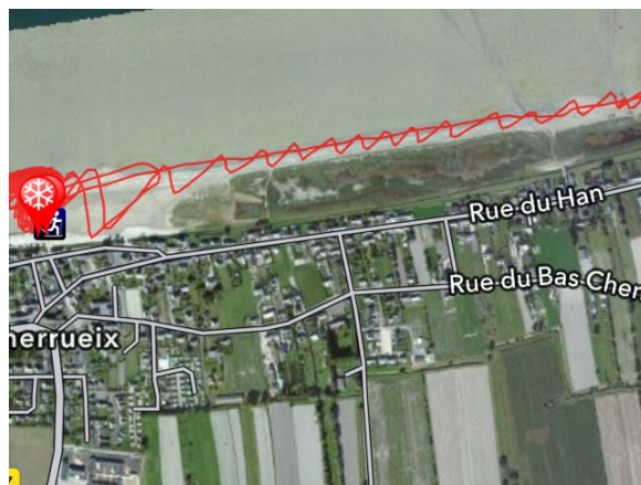
- zoom sur le louvoyage -

- 14h30 : c'est parti pour une série de 5 ou 6 manches sur la grève selon un parcours de 3 bouées rendu assez complexe par l'angle du vent (qu'elle était dure à rejoindre cette bouée côté Cancale !). 2 à 3 Minicat se joignent à nous (dont le Champion du Monde Junior).