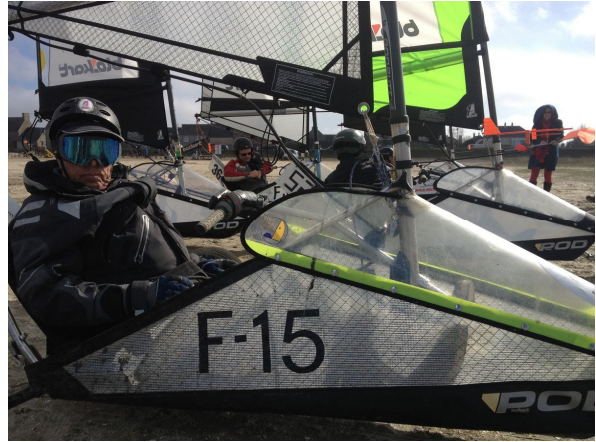
- Entre 2 manches... -