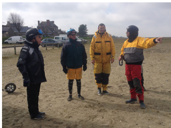
- briefing -

- 14h30 : c'est parti pour une série de 5 ou 6 manches sur la grève selon un parcours de 3 bouées rendu assez complexe par l'angle du vent (qu'elle était dure à rejoindre cette bouée côté Cancale !). 2 à 3 Minicat se joignent à nous (dont le Champion du Monde Junior).