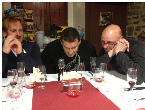
- sans commentaire... -