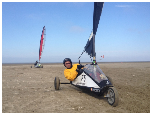
- " Ils m'énervent ces Minicat !!! " -